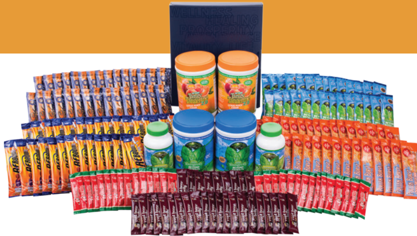
Demostrado Arriba: CEO Mega Pak™ (#1070)

Si estás serio acerca de la promoción del Healthy Body Challenge o de cualquiera de las distintas líneas de productos de Youngevity, el CEO Mega Pak abre las puertas a compensación y reconocimiento adicional. ¡Te da todo lo que necesitas para lograr un comienzo rápido! Este "negocio en una caja" contiene más de 500 dólares de los productos más populares de Youngevity, además el probado sistema de construcción de negocio de Youngevity.